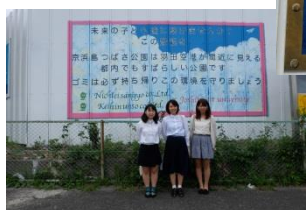
■ 女子美大有志代表の方々

お問い合わせ・ご意見はこちらまで・・・ 電話 03(3790)7400 FAX 03(3790)7401 http://nichiei-sangyo.jp/